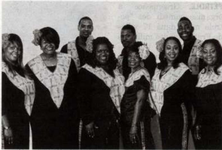
Les membres du Harlem Gospel Choir.

Tout droit venue de New York, la chorale de gospel Harlem Gospel Choir sera en représentation au Maroc, à Casablanca et Rabat, les 7, 8 et 9 octobre. Un concert donné par une formation reconnue de gospel formée en 1986, qui laisse présager un bon moment musical pour les amateurs comme les passionnés.